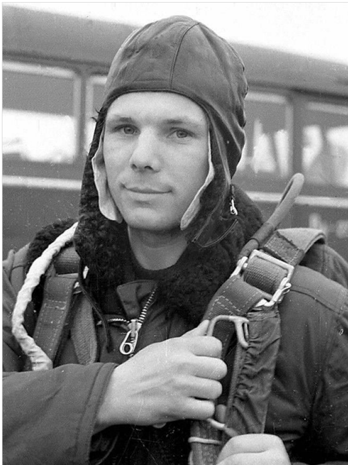
Юрий Алексеевич Гагарин (1934 – 1968)